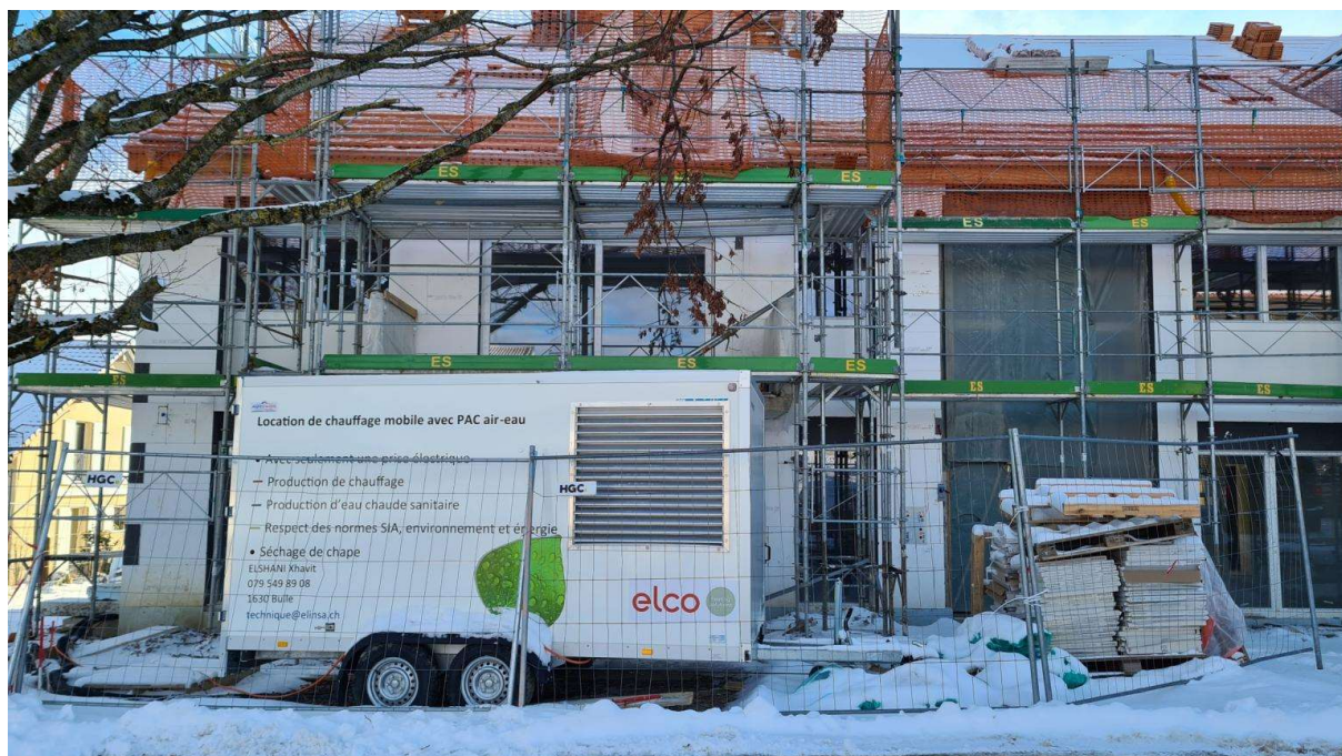
PAMPIGNY - Immeuble de 8 appartements