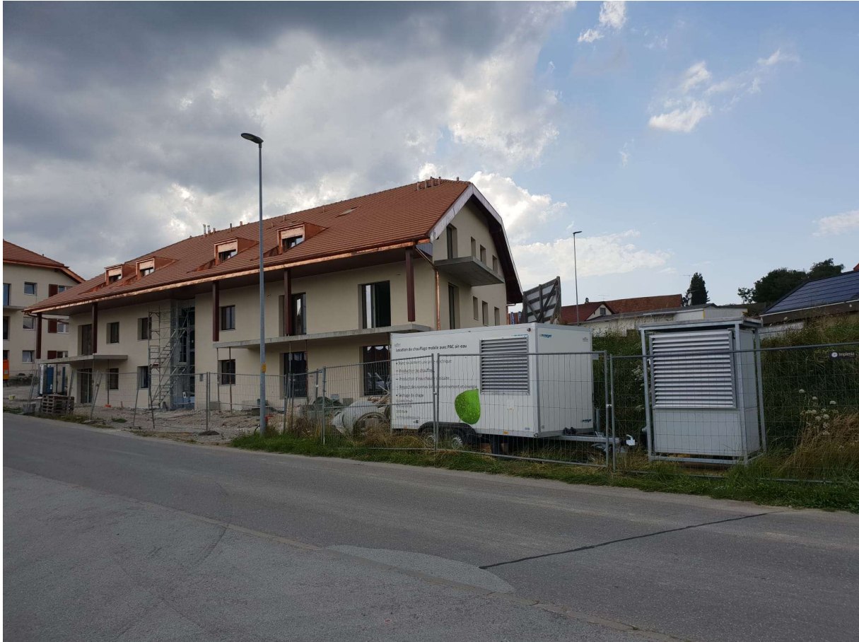
TORNY-LE-GRAND - Immeuble de 15 appartements